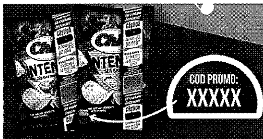
Exemplu de tiparire a codului promotional alaturi de sintagma "COD PROMO:"

Exemplu ambalaj promotional cu cod unic: